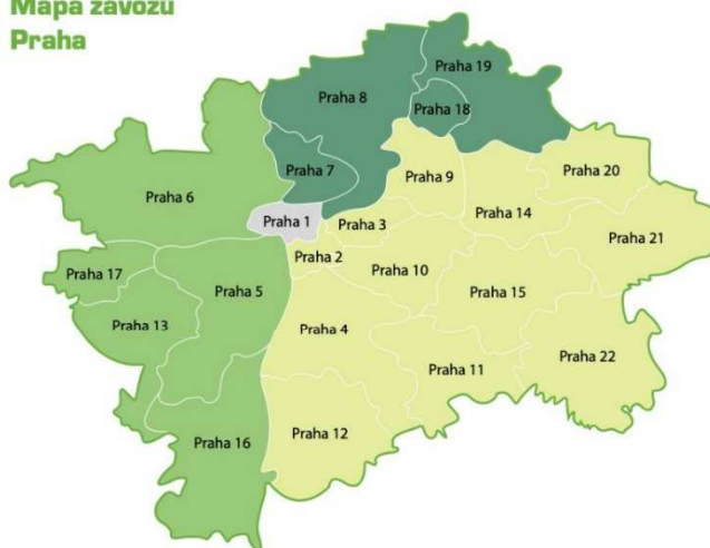
Mapa závozů Praha