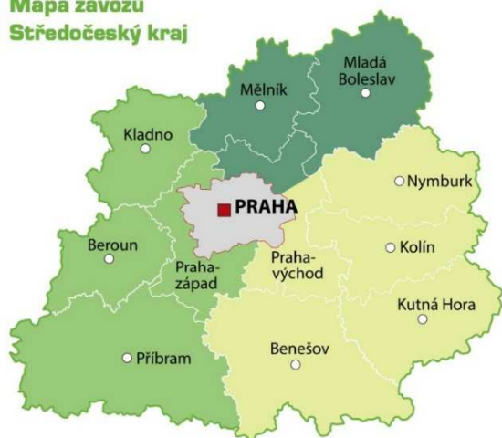
Mapa závozů Středočeský kraj